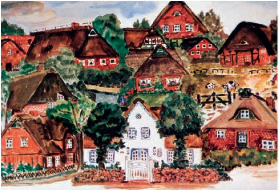
Sülldorfer Bauernhäuser gemalt von Margret Schröder.

MITTEILUNGSBLATT DES BÜRGERVEREINS SÜLLDORF-ISERBROOK E.V.